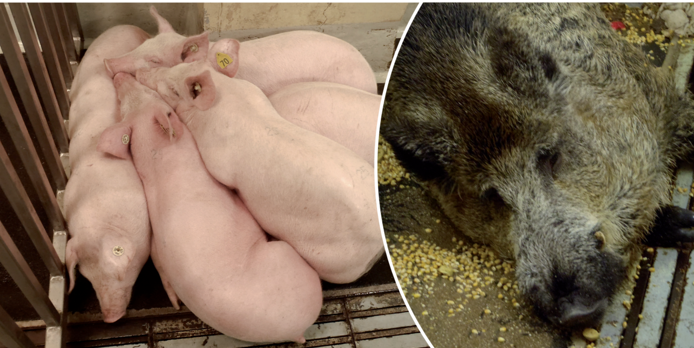
Abbildung 2 und 3: An ASP erkrankte Schweine zeigen hohes Fieber, reduzierte Futteraufnahme und suchen Wärmequellen auf

nen, ältere werden schnell noch vermarktet und tragen zur Übertragung über längere Distanzen bei. Primäre Ausbrüche konnten sehr häufig mit der Verfütterung von Speiseabfällen in Verbindung gebracht werden. Neben einer eher kriechenden Übertragung kam es auch zur Verschleppung über lange Distanzen. Dies belegen Ausbrüche in der Nähe von St. Petersburg und Murmansk eindrucksvoll. In einigen Fällen wurde das Virus über die Mitnahme von Tieren bzw. Schweinefleischprodukten durch das Militär aus den ASP-betroffenen Gebieten verschleppt.