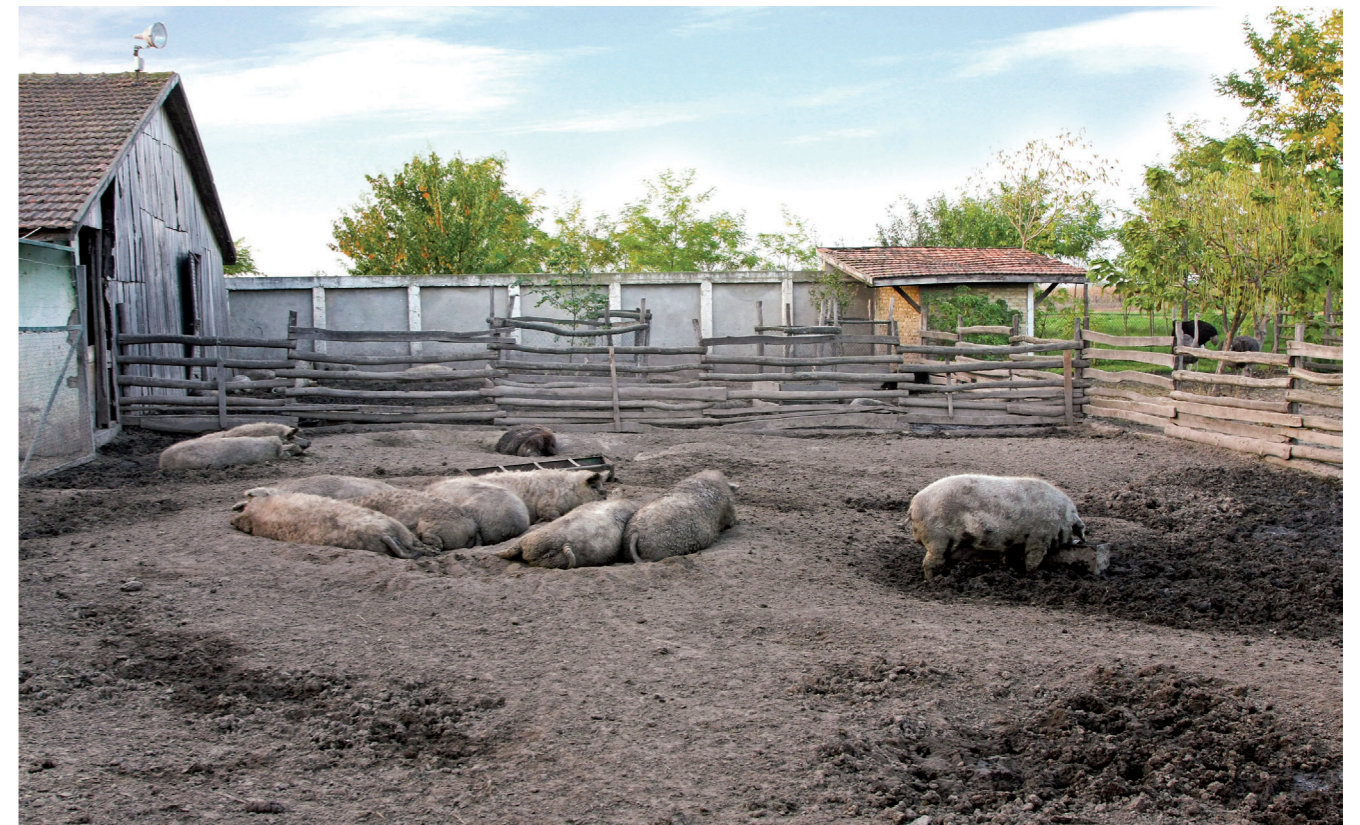
Abbildung 3: Die Seuche verbreitete sich auf Hausschweine in Hinterhofhaltung

Derzeit erfolgt kein legaler Import von Schweinen und Schweinefleischprodukten aus Russland und anderen betroffenen Staaten, es werden aber täglich Schlachtschweine aus der EU dorthin exportiert. Die Transporter müssen vor Ort desinfiziert werden. Dennoch bleibt ein Einschleppungsrisiko für ASP durch die zurückkehrenden Fahrzeuge bestehen, wenn Anschlusstransporte vor Wiedereintritt in die EU durchgeführt werden oder, insbesondere im Winter, die Reinigung und Desinfektion nicht optimal durchgeführt werden. Experimentell wurde gezeigt, dass sehr geringe Virusmengen für eine Infektion ausreichen können. Auch ein unachtsam auf einer Raststätte entsorgtes ASP-kontaminiertes Wurstprodukt auf einem „Pausenbrot“, stellt ein Risiko für das Schwarzwild dar. Diesbezüglich ist